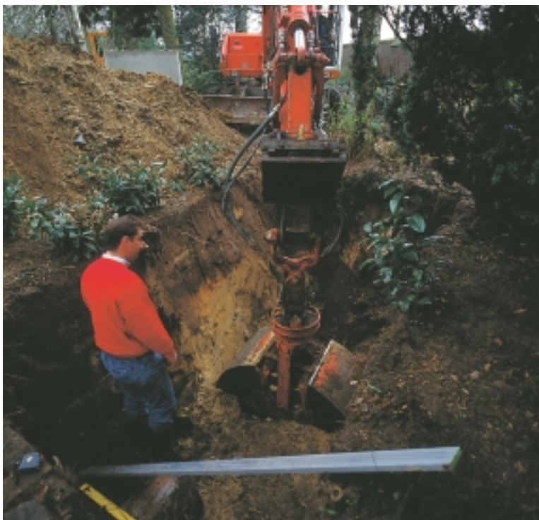
Vorbereidingen voor het plaatsen van de put

De levering van centrale voedingskasten - CVK's - vindt vanzelfsprekend plaats volgens de eisen van de betrokken energiebedrijven.