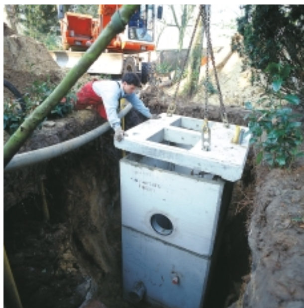
Minigemaal voor 2 pompen