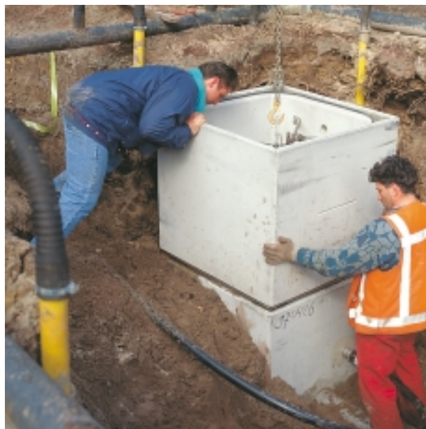
De uit segmenten opgebouwde put wordt geplaatst

Naast het Minigemaal® leveren wij het Totaalgemaal®, een in hoge mate gestandaardiseerd rioolgemaal dat binnen 4 weken kan worden geleverd en geïnstalleerd. De prijs is in verhouding met de kwaliteit verrassend laag te noemen.