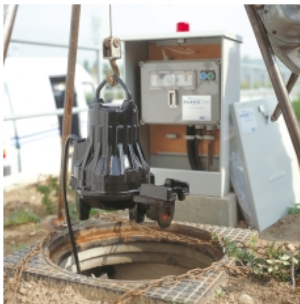
"Klaar voor bedrijf"